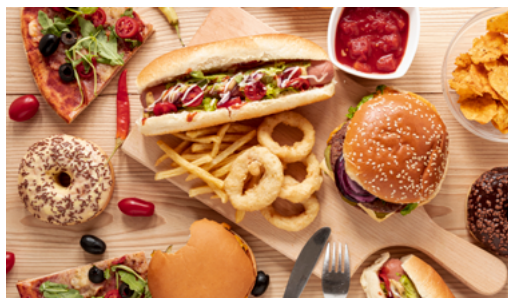
» Figura 4. Alimentos gordurosos e ultraprocessados.

São industrializados e com baixo poder nutricional. Ricos em calorias, açúcares, gorduras e cheios de aditivos químicos (Figura 4). Devem ser evitados, pois favorecem a ocorrência de deficiências nutricionais, obesidade, doenças cardiovasculares e diabetes. Exemplos: biscoitos, sorvetes e guloseimas; bolos; cereais matinais; barras de cereais; sopas, macarrão e temperos “instantâneos”; salgadinhos “de pacote”; refrescos e refrigerantes; achocolatados; iogurtes e bebidas lácteas adoçadas.