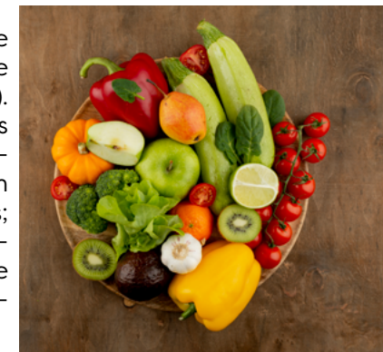
» Figura 1. Alimentos in natura.

Extraídos de plantas e animais e não passaram por nenhum tipo de processo (não processados) (Figura 1). Exemplos: verduras, legumes e frutas (frescas ou secas); tubérculos (batata, mandioca etc.); arroz; milho (em grão ou na espiga); cereais; farinhas; feijão e outras leguminosas; cogumelos (frescos ou secos); sucos de frutas (sem açúcar ou outras substâncias); leite; iogurte.