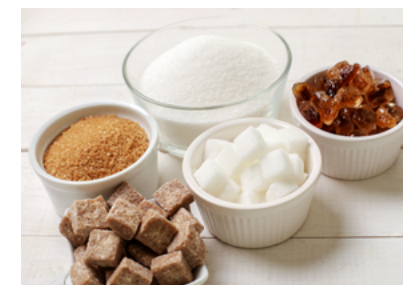
» Figura 2. Diferentes tipos de açúcares.

Alimentos in natura, porém passaram por alguma alteração mínima (moagem, secagem, etc.) (Figura 2). Exemplos: óleos vegetais, azeite, manteiga, banha de porco, gordura de coco, açúcar de mesa branco, demerara ou mascavo, melado, rapadura e sal de cozinha.