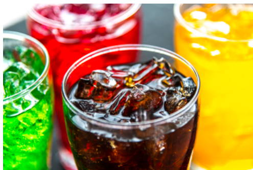
» Figura 11. Bebidas açucaradas