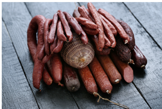
» Figura 7. Exemplos de alimentos embutidos.