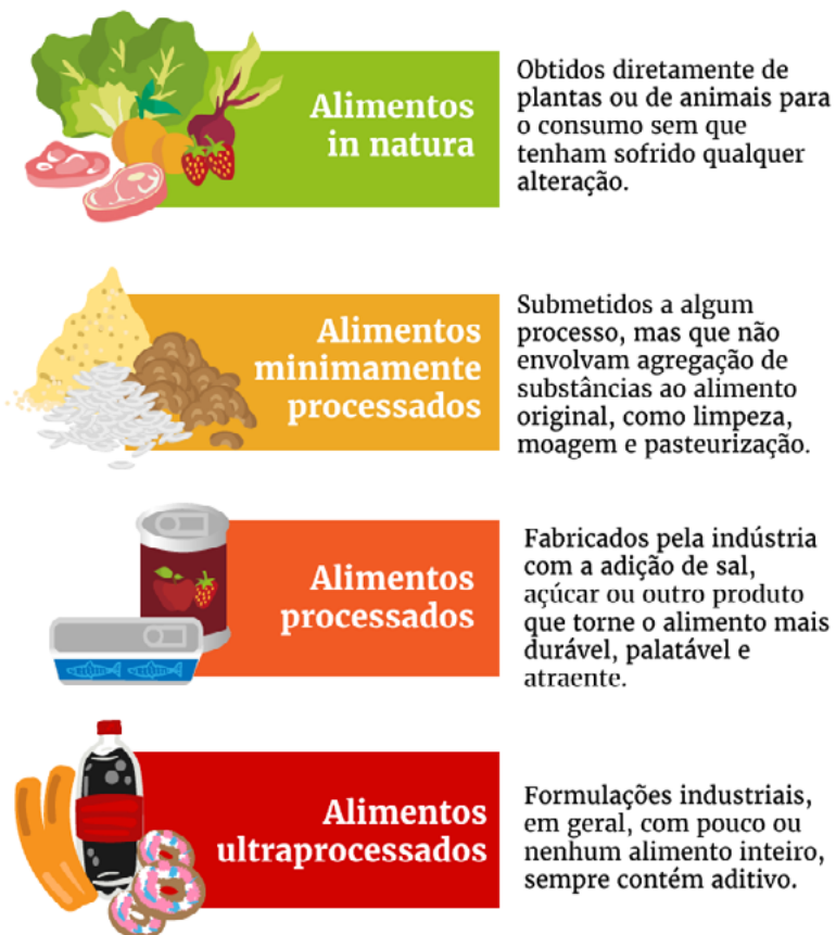
» Figura 6. Categoria de alimentos existentes.