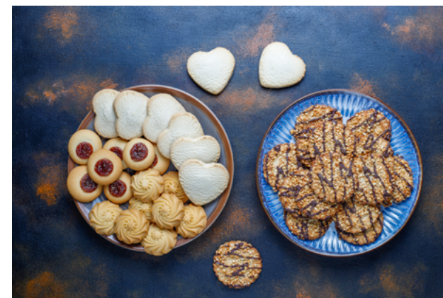
» Figura 8. Biscoitos e bolachas.