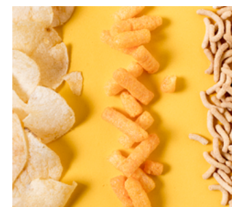
» Figura 9. Salgadinhos de pacote.