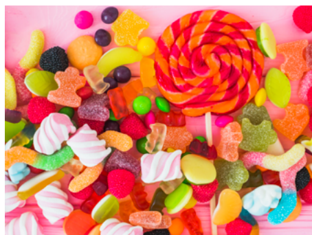
» Figura 10. Guloseimas e doces em geral.