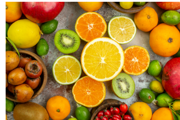
» Figura 12. Frutas, verduras e legumes.