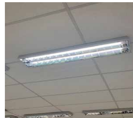
» Figura 2. Iluminação da sala com lâmpadas de LED tubulares