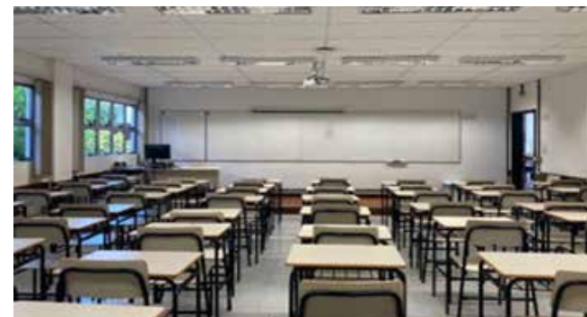
» Figura 1. Sala de aula vazia.